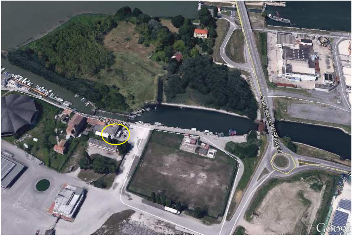
Immagine da satellite